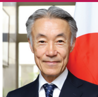
Shigeo Yamada Ambassador Extraordinary and Plenipotentiary of Japan to the United States