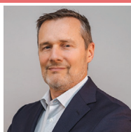
ロジャー・ハリス