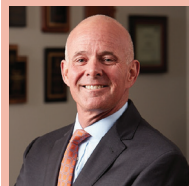
カルロス・プラセラス