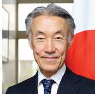
Shigeo Yamada Ambassador Extraordinary and Plenipotentiary of Japan to the United States