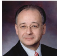
ポール・スコウテラス